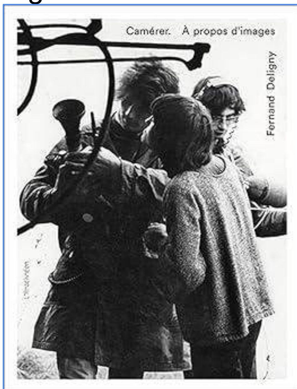
Capa do livro

A bolsista se dedica ao estudo do livro por meio da tradução para a língua portuguesa.