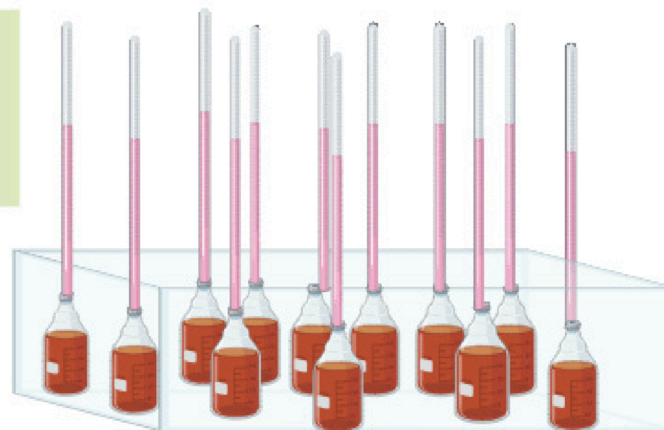
Eudiômetros foram montados e analisados durante 15 dias