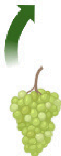
Resíduo de uva