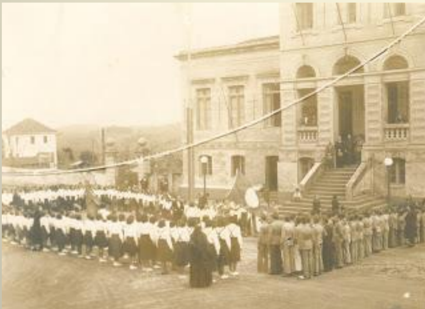
Figura 1 – Grupo Escolar General Bento Gonçalves da Silva, instalado em 15 de março de 1910 na atual prefeitura do município.