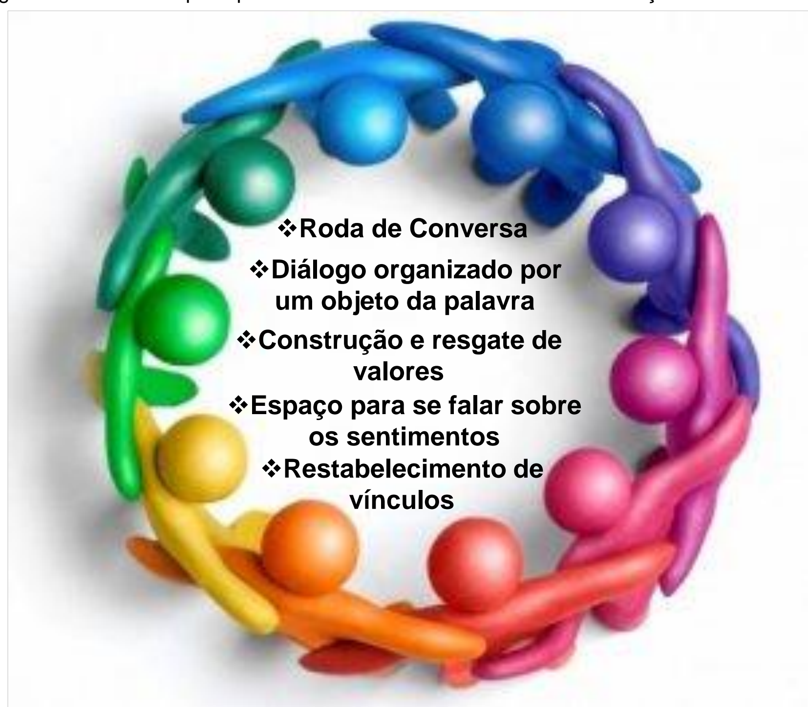
Figura 1 – Síntese de princípios sobre a essência do Círculo de Construção de Paz