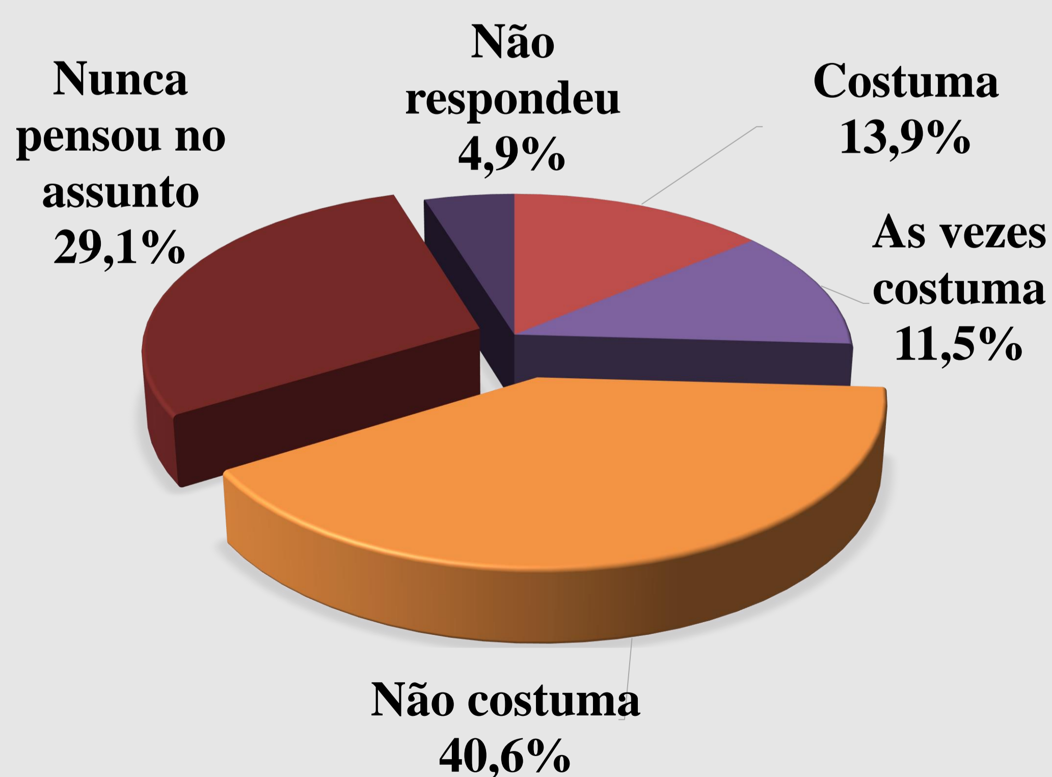
Gráfico 1- O hóspede costuma reservar meios de hospedagem movido por critérios sustentáveis?